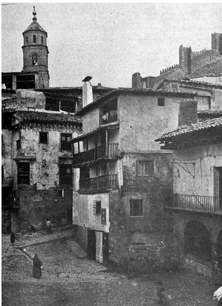
Figura 2. Fotografía de la Plaza Mayor de Albarracín de Kurt Hielscher entre 1913 y 1918.

El Concordato de 1851 trajo consigo una importante reorganización eclesiástica, uniendo la Diócesis de Albarracín con la de Teruel, lo que puso fin a siete siglos de obispado independiente 10 . Esta pérdida de un centro religioso y administrativo importante redujo el prestigio local, las oportunidades de empleo (para el clero, administradores y servicios asociados) y la vitalidad cultural, contribuyendo a una gradual emigración de ciertos segmentos de la población vinculados a la influencia predominante de la iglesia. Este periodo marcó el inicio de los primeros movimientos poblacionales migratorios documentados, que se acelerarían en el éxodo rural del siglo XX. Como indica Silvestre (2004), a partir de 1860 sería el momento de salida continua de la población rural en España (Erdozain y Mikelarena, 1996). Y ello debido a los efectos de la sobrepoblación de los campos y la quiebra de una parte de los trabajos que componían la pluriactividad campesina. En cualquier caso, la llegada de cereales procedentes del exterior a finales del siglo XIX provocó un aumento de la emigración rural. Una emigración que, junto a la