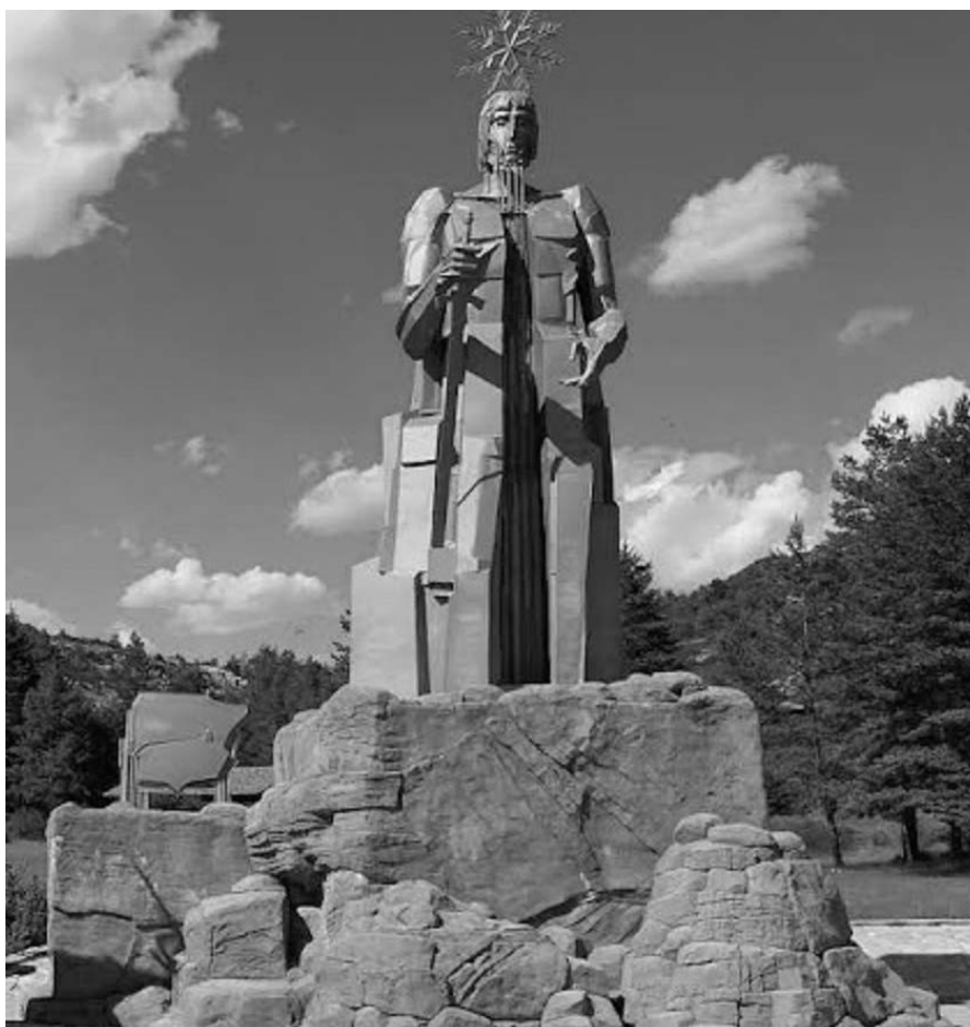
Figura 1. Monumento al Padre Tajo de José Gonzalvo Vives.