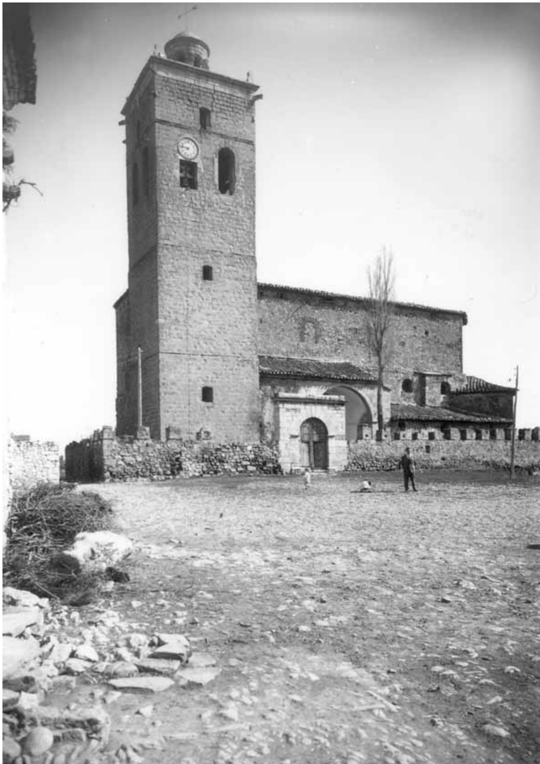
Figura 3. Fotografía de la Iglesia de Jabaloyas de Francisco López Segura en los años 60 del siglo XX.