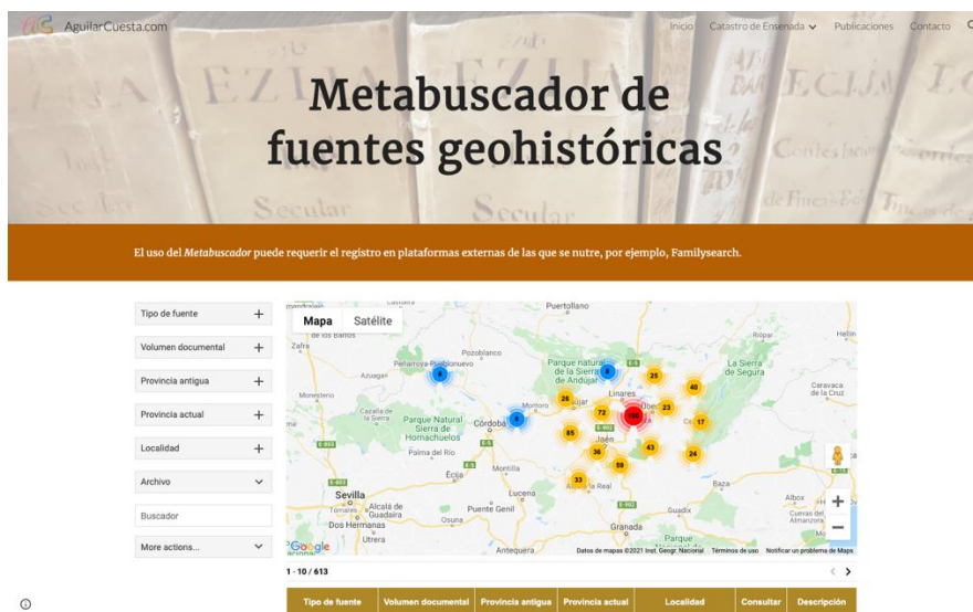
Figura 2. Metabuscaor de fuentes geohistóricas.